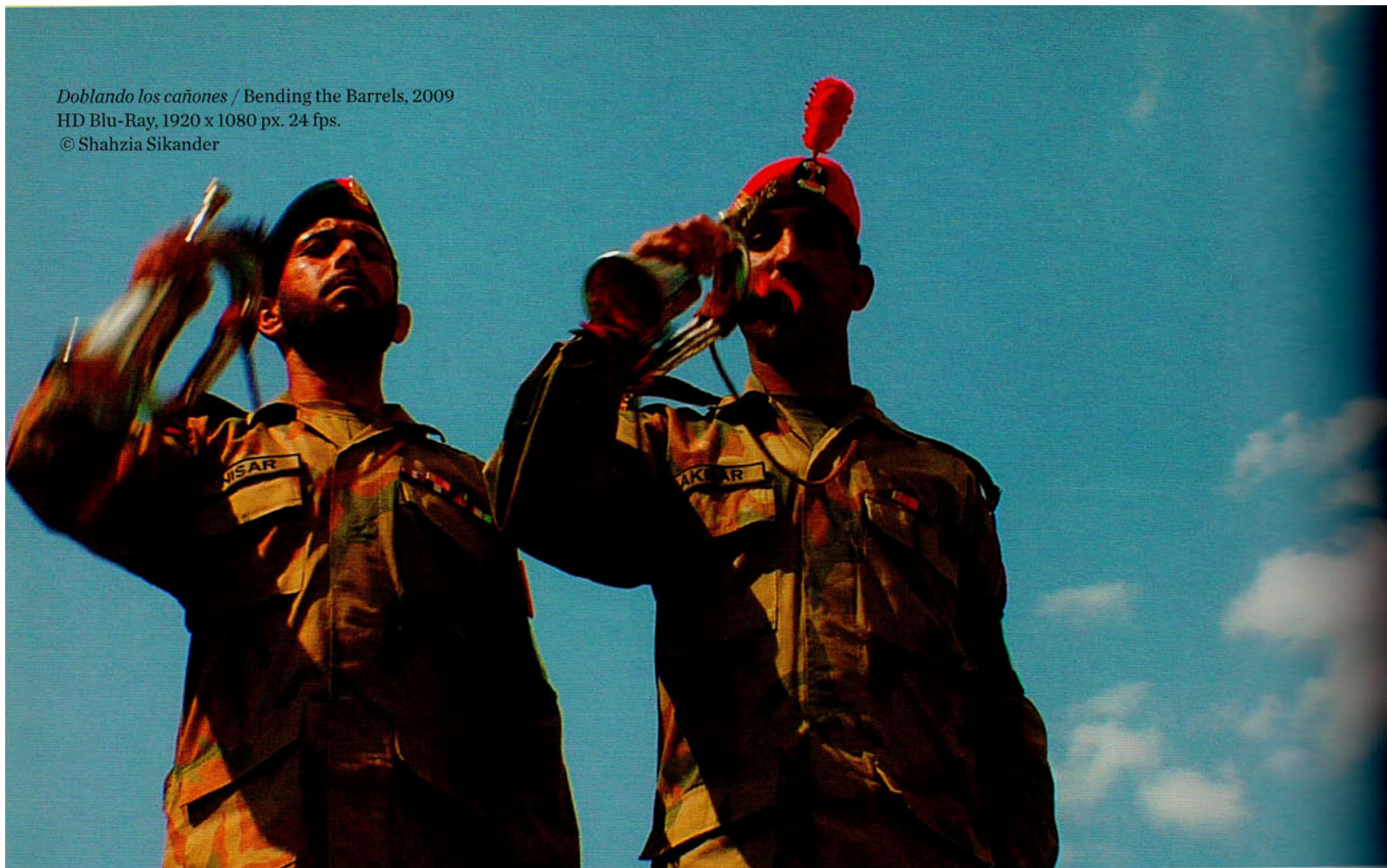
Doblado los cañones / Bending the Barrels , 2009 HD Blu-Ray, 1920 x 1080 px. 24 fps. © Shahzia Sikander