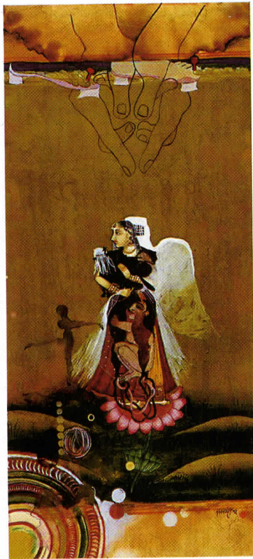
Shahzia Sikander aquarelliert mit Pflanzenfarben und Tee: „Entwurzelte Ordnung I“ (1997)

Termin: bis 6. Januar 2003. Katalog: 29,95 US-Dollar. Internet: www.moma.org